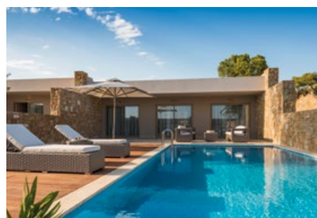
Beispielbilder aus dem GIATA Hotel Guide, Hotel Ikos Olivia, Griechenland